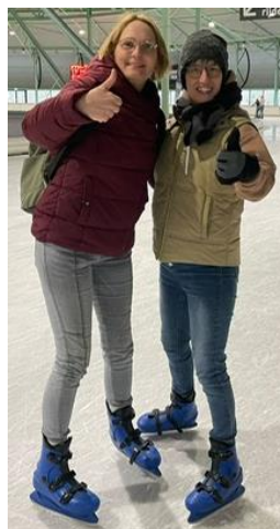
Zwei auf dem Eis