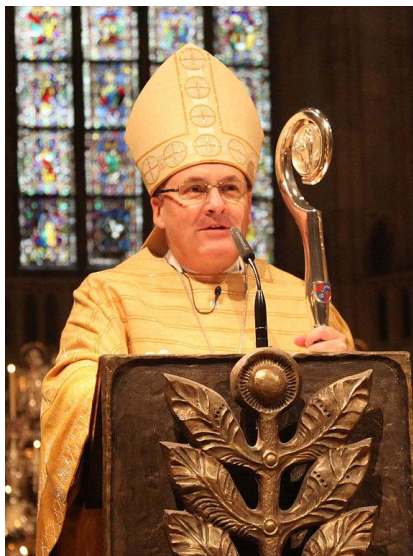
Bischof Rudolf Voderholzer

Regensburg. In seine Amtszeit fiel insbesondere der 99. Deutsche Katholikentag, der 2014 in Regensburg stattfand und an dem knapp 50.000 Besucher teilnahmen.