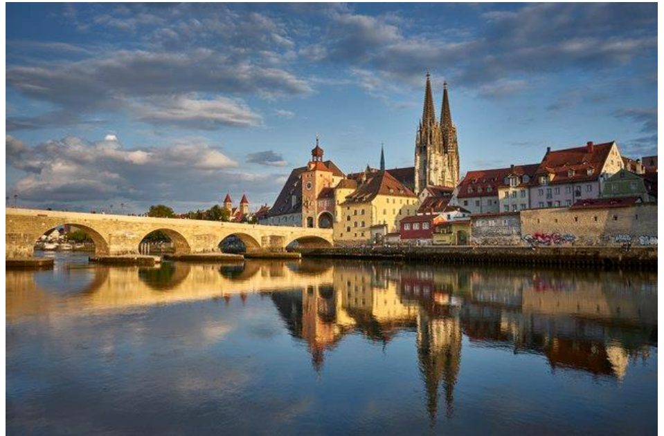
Regensburg an der Donau mit Blick auf den Dom

Von 1260 bis 1262 war Albertus Magnus Bischof von Regensburg. Albertus Magnus beschäftigte sich als