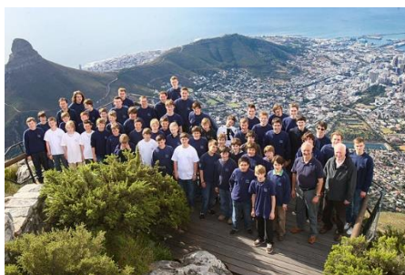
Die Regensburger Domschatzen in Südafrika