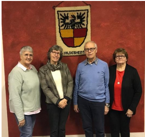
Der alte neue Vorstand