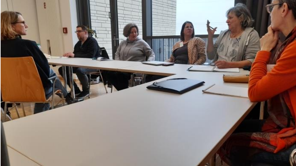
Die Gehörlosenseelsorger diskutierten am letzten Tag in einer eigenen Gruppe

Zu ihrer Bundestagung trafen sich vom 11. – 13. März Seelsorgende für Menschen mit Behinderungen in Paderborn. Thema war „Seelsorge zukunftsfähig gestalten“.