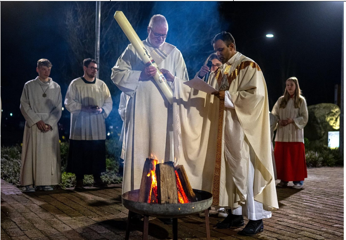
In der Osternacht wird die Osterkerze am Osterfeuer entzündet.

Gehörlosentreff beim Katholikentag in Erfurt