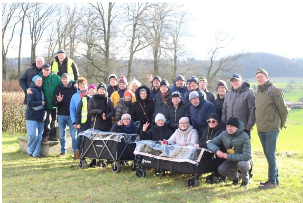
Die wackeren Wanderer mit ihren wichtigen Bollerwagen