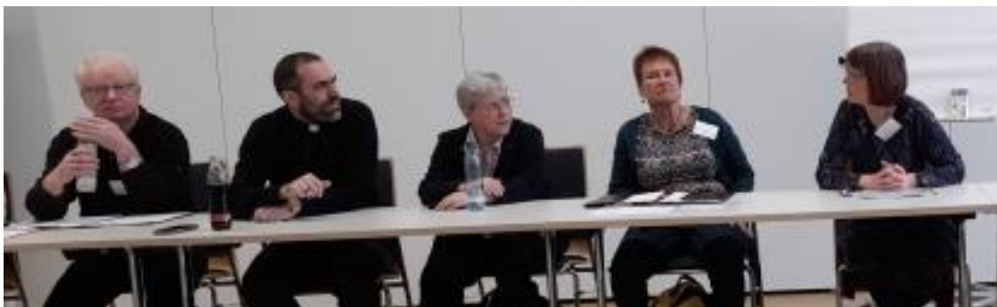
Bundestagung der Behindertenseelsorger(innen) – mehr auf Seite 8