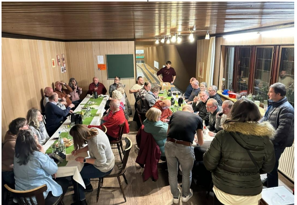
Prächtige Stimmung auf der Kegelbahn

Sie berichtete weiter über unsere Mitgliederversammlung im März, Chronikheft, Coda-Woche im Allgäu (Bayern) für hörgeschädigte Eltern mit hörenden Kindern, Kulturtage in Friedrichshafen am Bodensee im September.