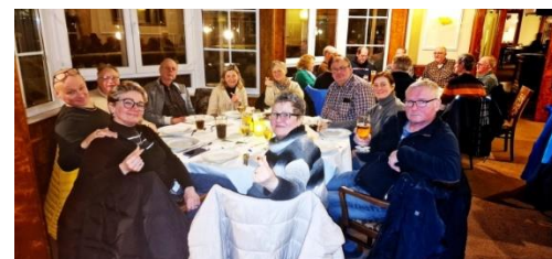
Hier freuen sich alle auf den leckeren Grünkohl.